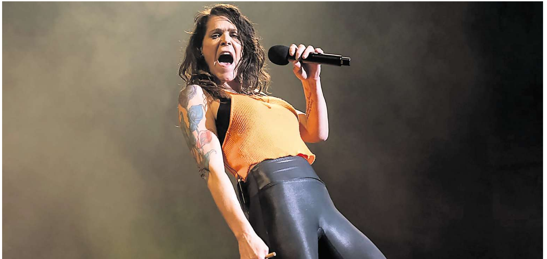
Beth Hart – hier ein Archivbild: Vom Konzert in Hannover gibt es keine aktuellen Bilder, die Bedingungen des Managements waren für die Redaktion inakzeptabel.

Ein anderes Mal bricht sie zur Verwunderung selbst ihrer Mitmusiker einen Song auf halbem Weg ab, weil sie einen kurzen Klavierpart verweigert hat. „Nein, ganz im Ernst, wir fangen noch mal an.“ Zwischen durch erzählt sie kurze Anekdoten aus ihrer langen Karriere, die von vielen bemerkenswerten Kollaborationen mit Joe Bonamassa, Slash und Jeff Beck, aber auch von Sucht und Krankheit gekennzeichnet war. Das Hier und Jetzt, sagt sie, gelte es